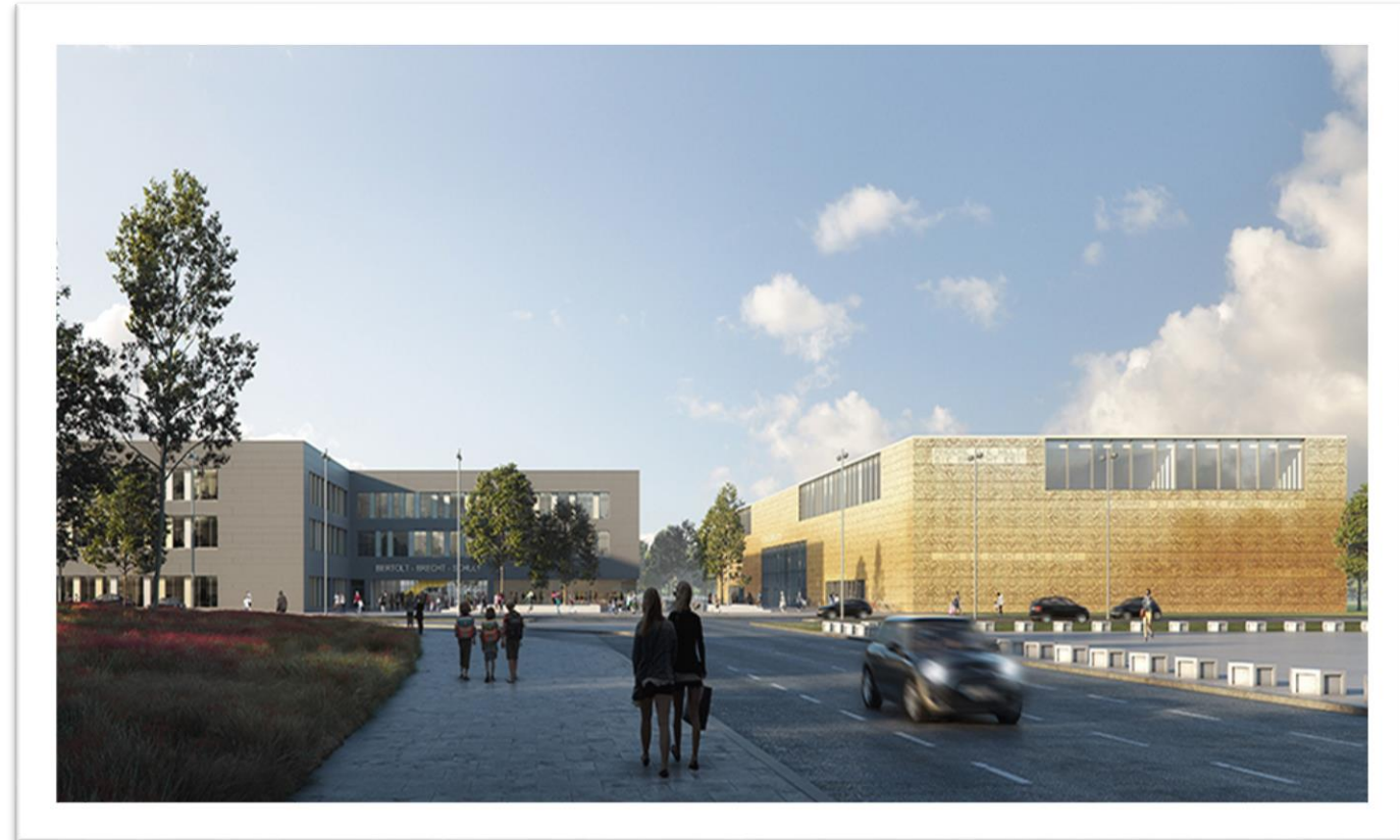
Visualisierung: bloomimages, Hamburg